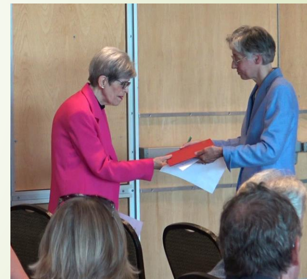
Remise d'un certificat de reconnaissance de l'Université du 3 e âge de l'Université Laval